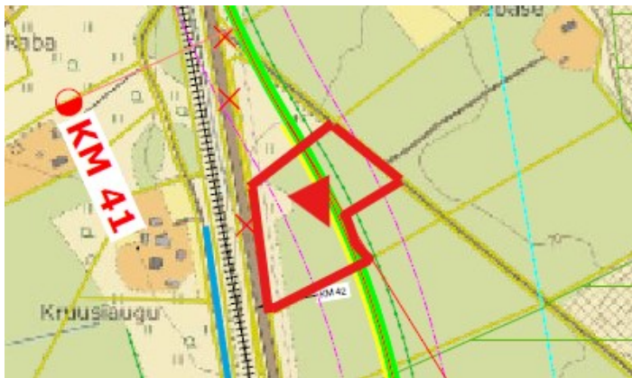
Joonis 3 Õnnemetsa kinnistu asukoht

Õnnemetsa kinnistu jääb suures ulatuses riigitee nr 15 uude kavandatud trassikoridori (vt Joonis 3), tee- ja teekaitsevööndi alale. Riigitee kaitsevööndis on keelatud EhS § 70 lg 2 ja § 72 lg 1 nimetatud tegevused, sh on keelatud ehitada ehitusloakohustuslikku teist ehitist. Transpordiamet ei nõustu elamu ehitamisega perspektiivse tee ja teekaitsevööndi alale.