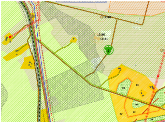
Joonis 2 Väljavõtte kehtivast üldplaneeringust

Ka koostatava Rapla valla üldplaneeringu kohaselt on Õnnemetsa kinnistu metsa maa-ala. Planeerimisseaduse (PlanS) § 6 lõike 9 kohaselt on maakasutuse juhtotstarve üldplaneeringuga määratav maa-ala kasutamise valdav otstarve, mis annab kogu määratud piirkonnale edaspidise maakasutuse põhisuunad. Kehtiva üldplaneeringu kohaselt „Detailplaneering tuleb koostada juhul, kui soovitakse muuta käesoleva planeeringuga sätestatud juhtotstarvet“. Projekteerimistingimuste eelnõus juhtotstarbega seonduvat käsitletud ei ole. Meie arvates ei ole Õnnemetsa kinnistu (osaline) kasutuselevõtmine elamumaana üldplaneeringuga kooskõlas ning kuna PlanS-is ja EhS-is puudub võimalus üldplaneeringu muutmiseks projekteerimistingimustega, ei saa me eelnõuga esitatud kujul nõustuda.